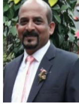
Title: Amar Jivithache Poinaar